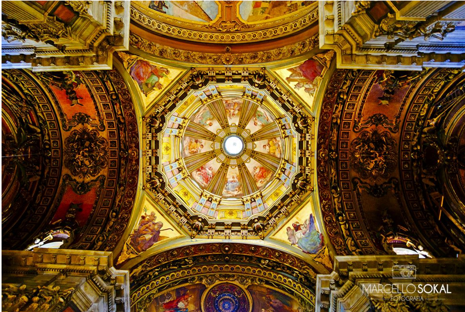
Igreja da Candelária, para mídia publicitária, Rio de Janeiro