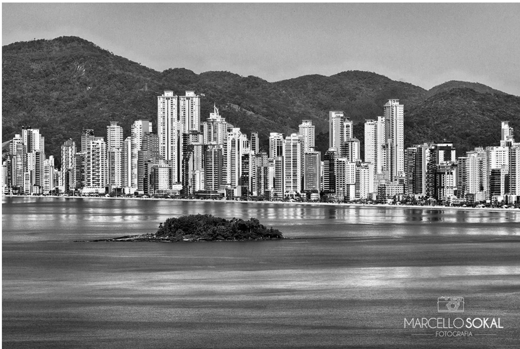
Balneário Camboriú, Santa Catarina