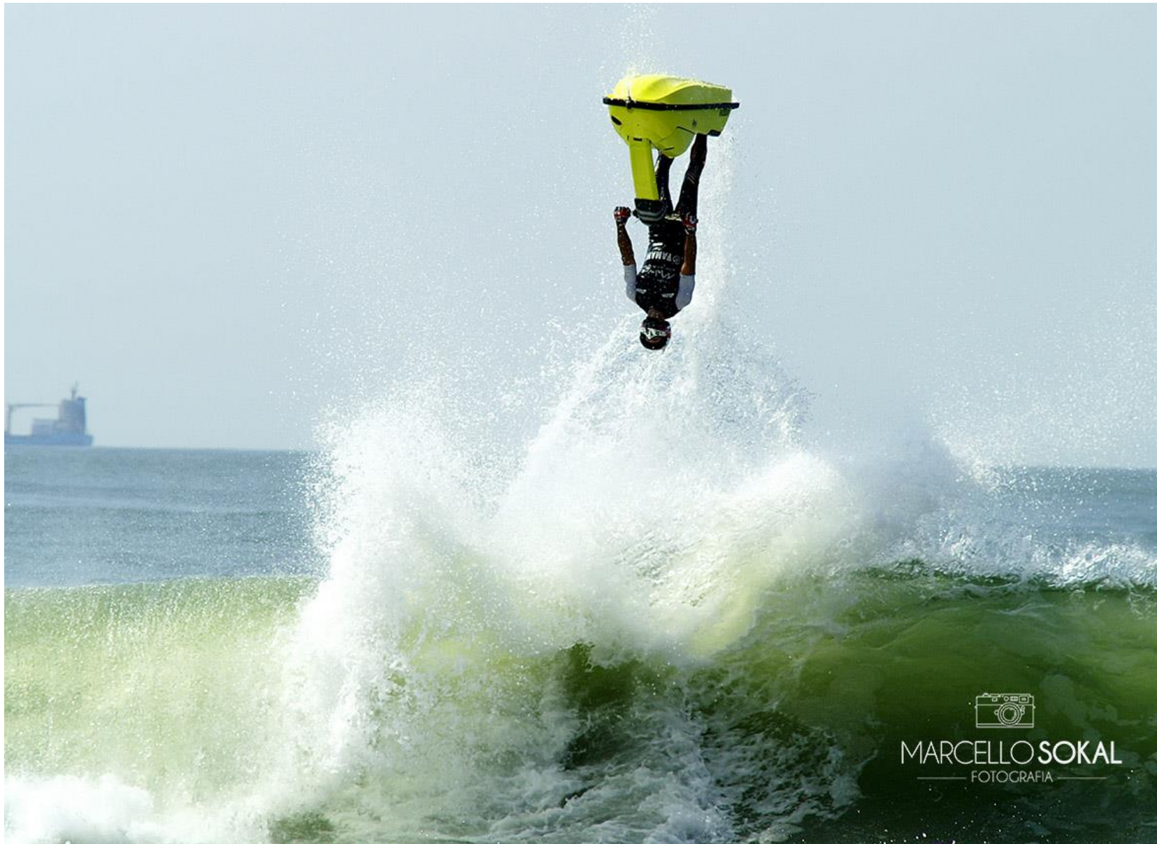
Itajaí, Santa Catarina, para mídia editorial