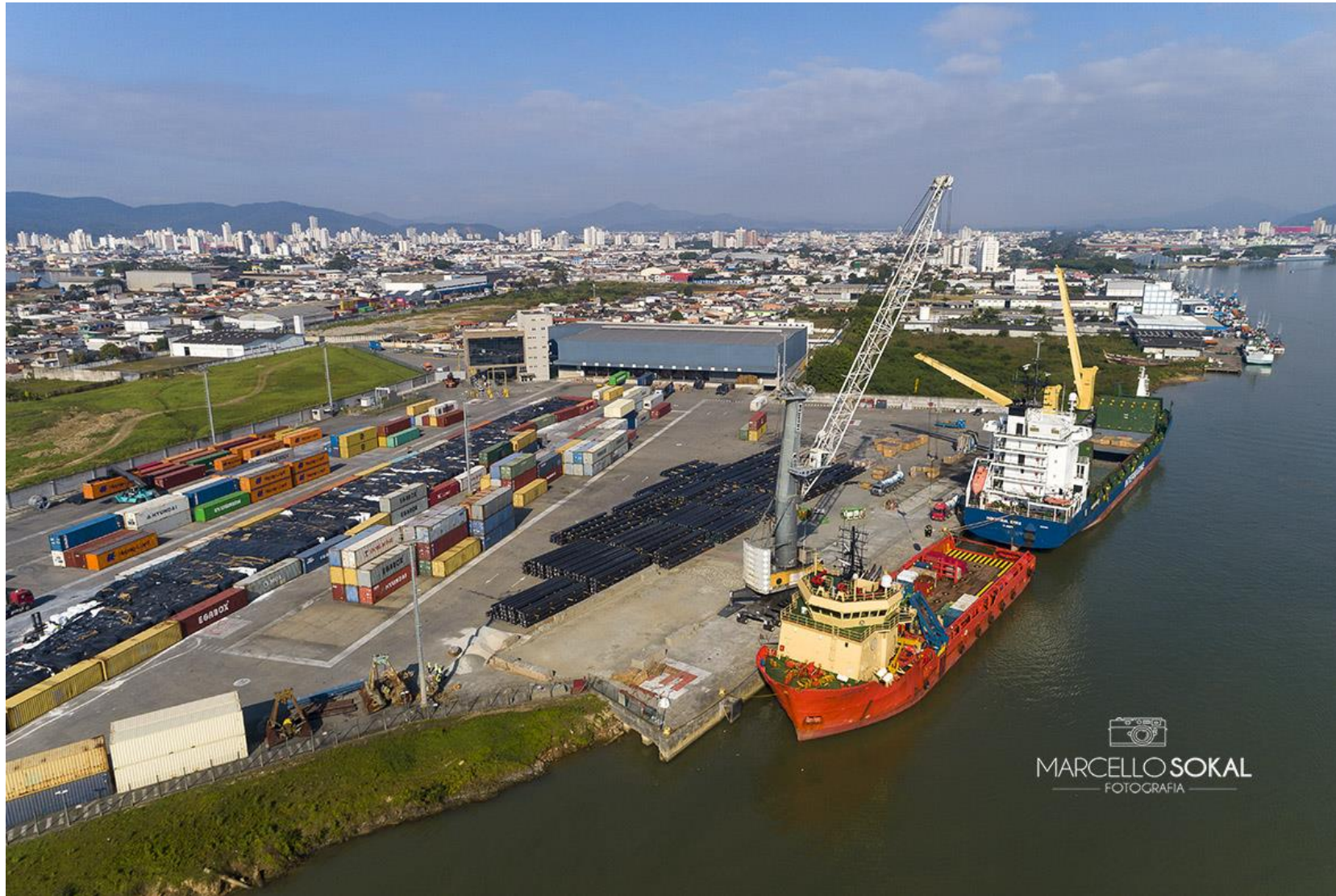
Terminal Barra do Rio, Itajaí, SC