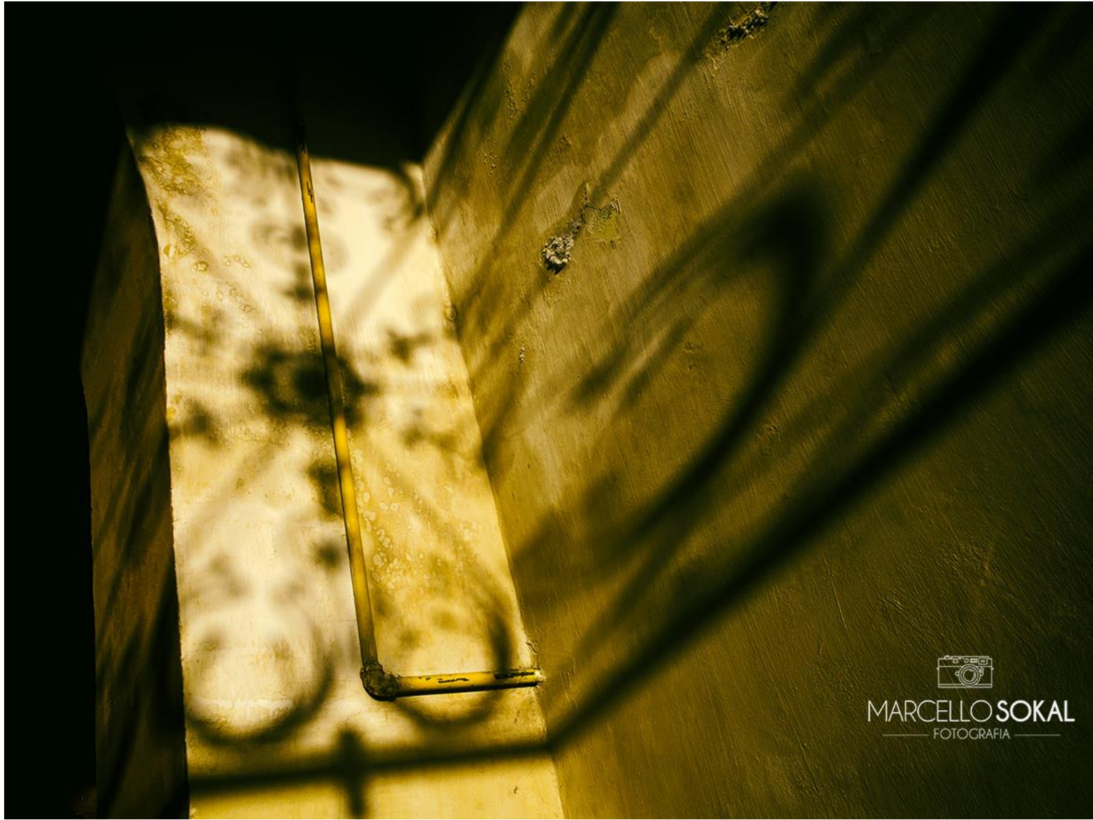
Autorial, Rio Grande, Rio Grande do Sul