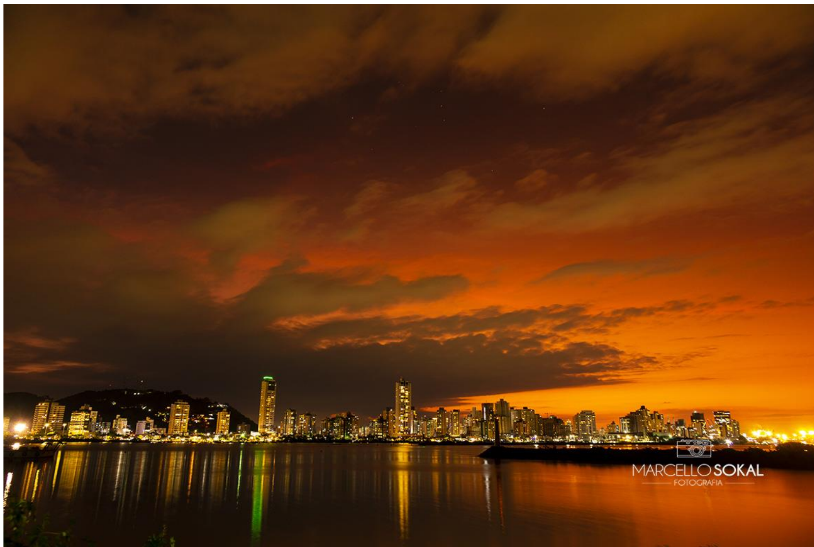
A Cidade de Itajaí ao entardecer