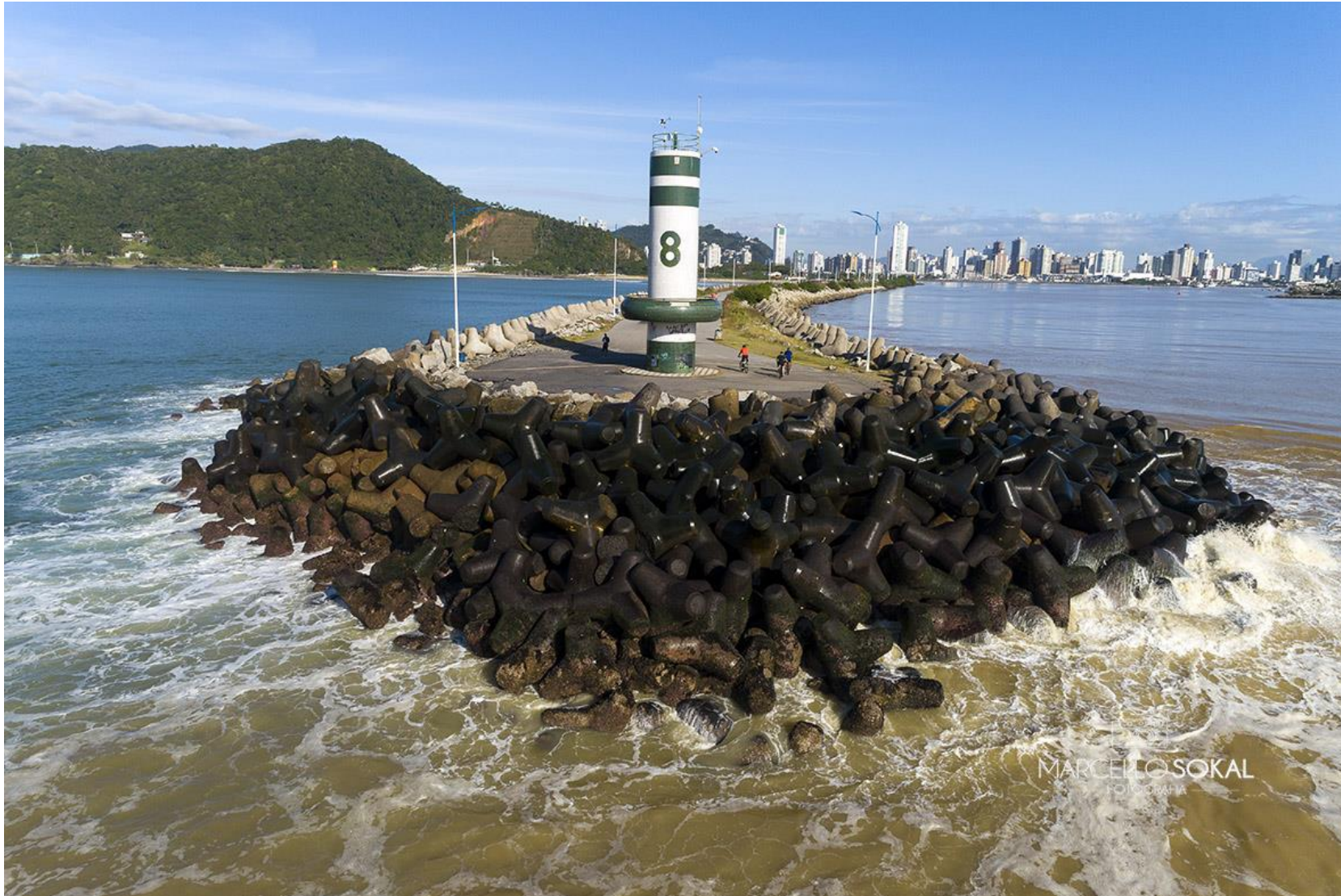
Molhe de Itajaí e Farol N° 8 da Marinha do Brasil.