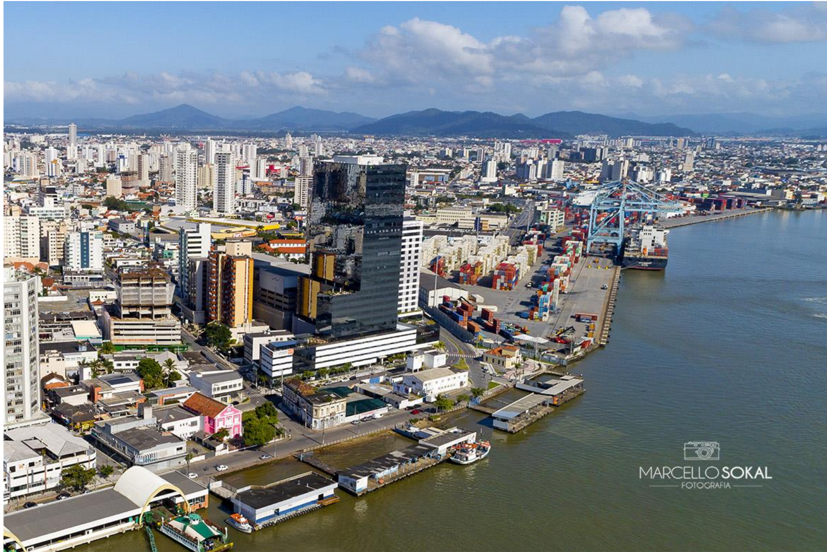
A Cidade de Itajaí, em SC