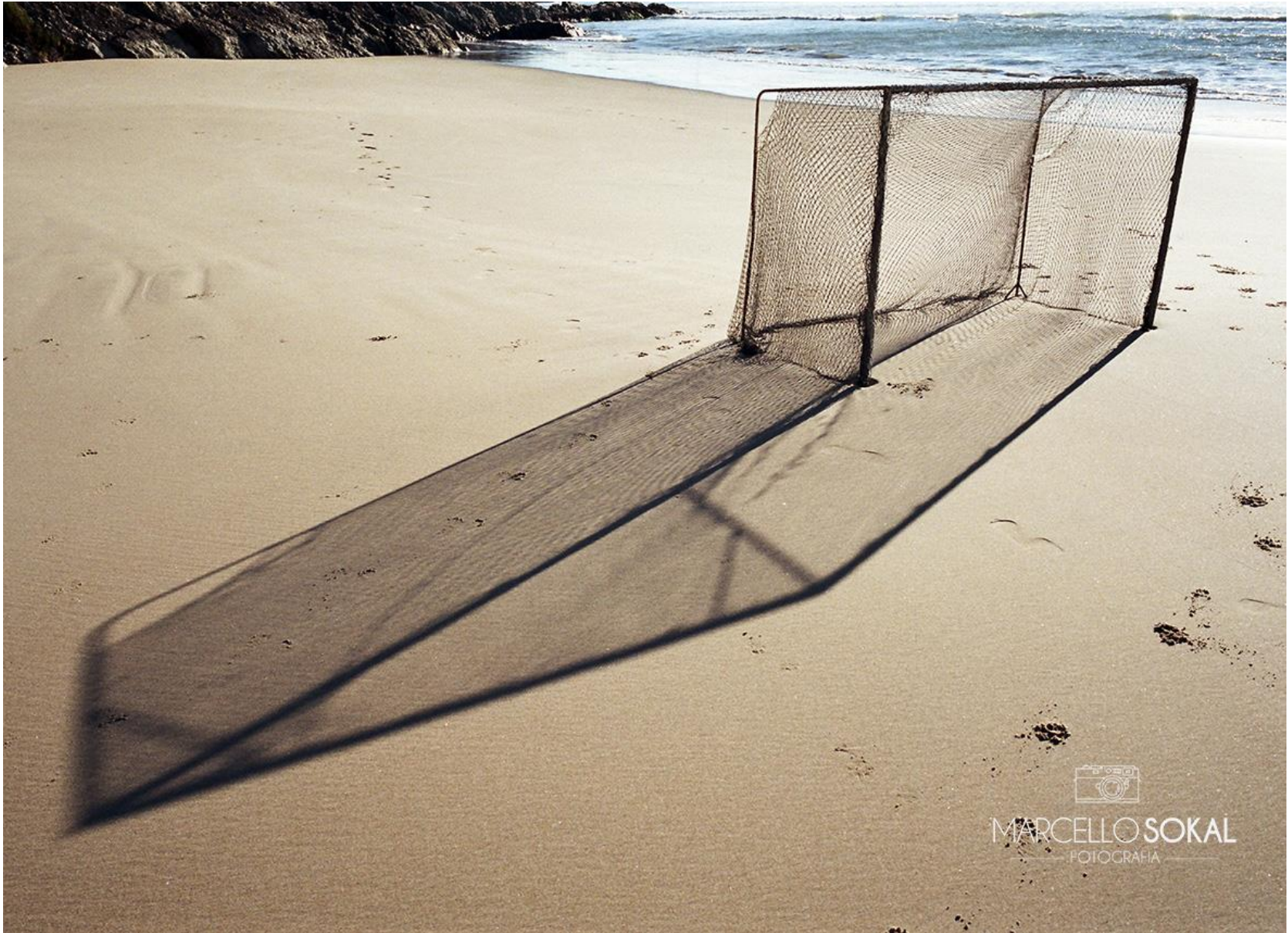
Itajaí, Autorial, Santa Catarina