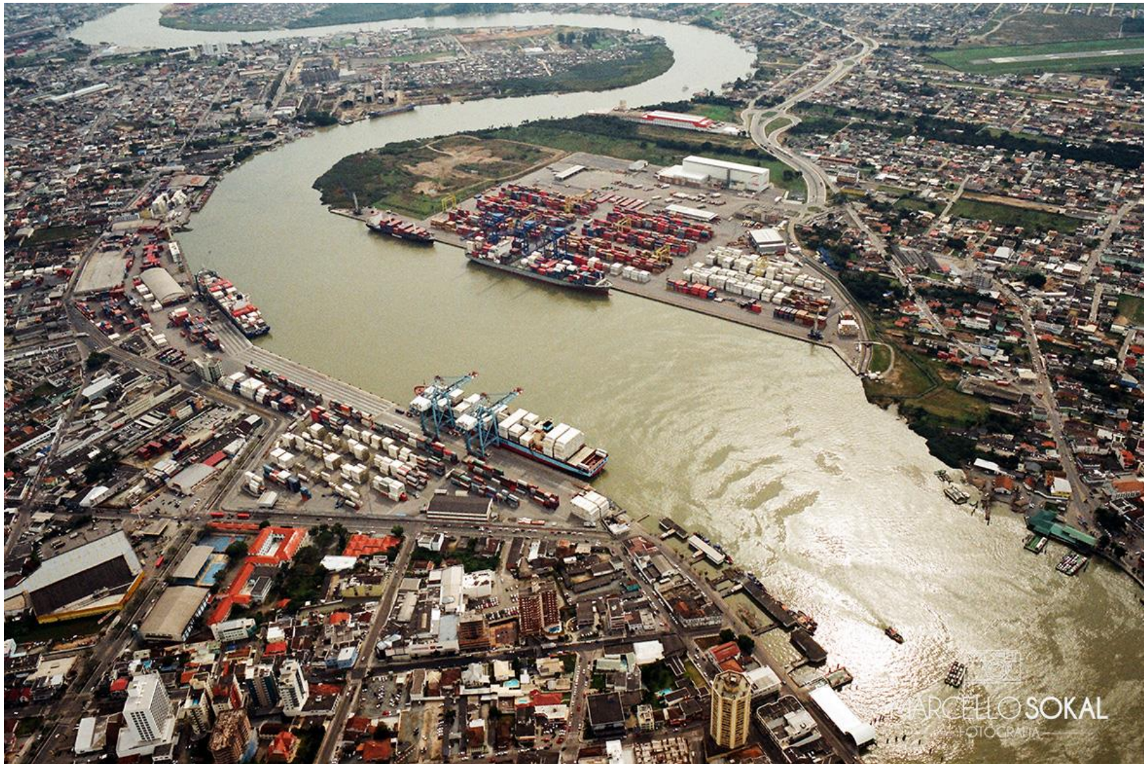
Portos de Itajaí e Navegantes, Santa Catarina