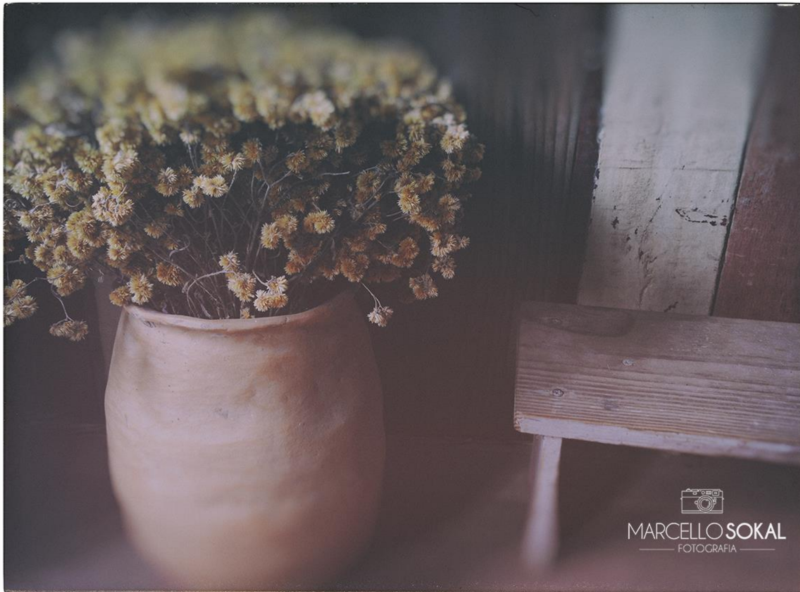
Autoral, Blumenau, Santa Catarina