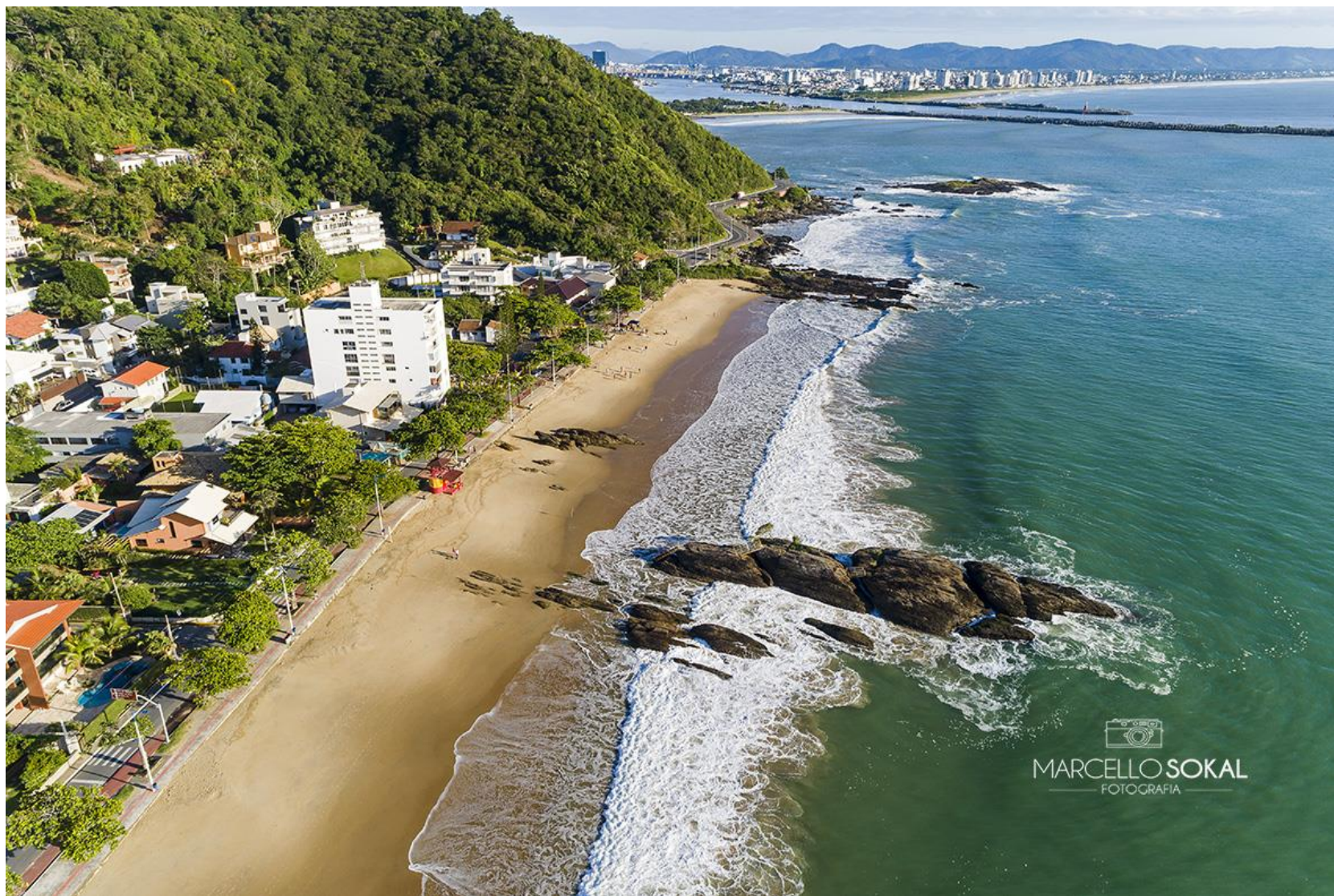
A praia de cabeçudas, em Itajaí, SC