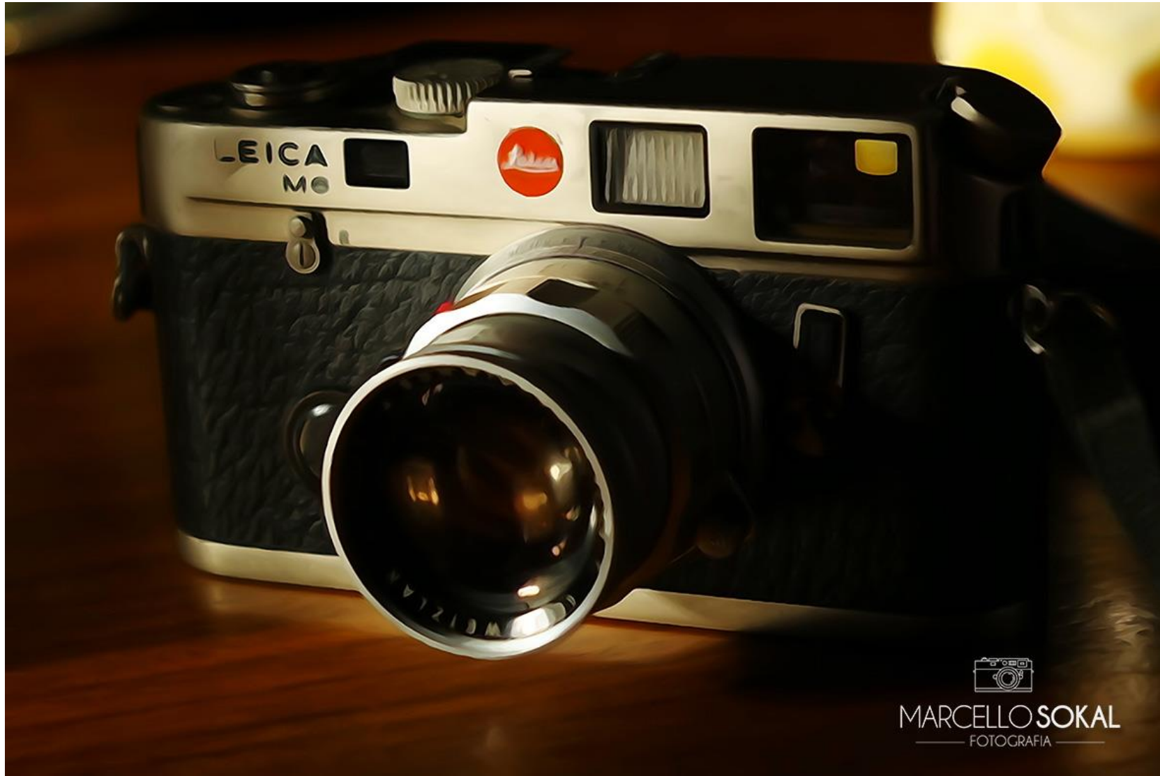
Atoral, Rio de janeiro