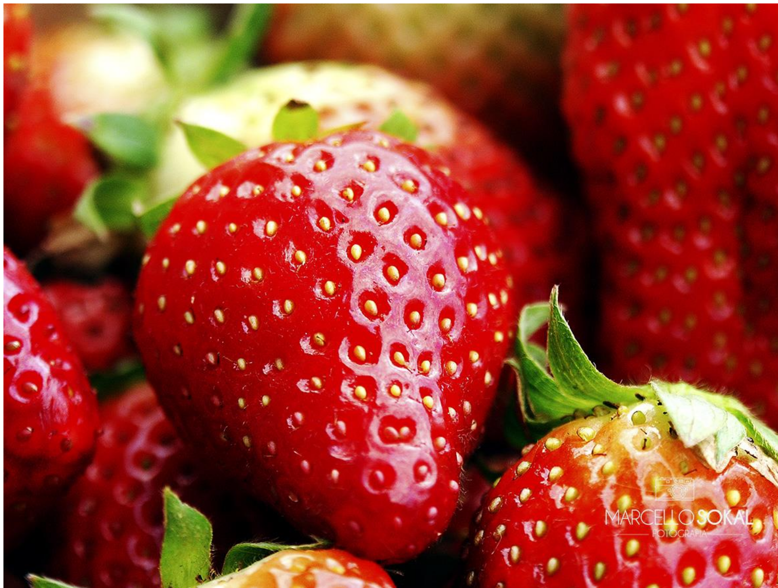
Rio de Janeiro, para mídia publicitária