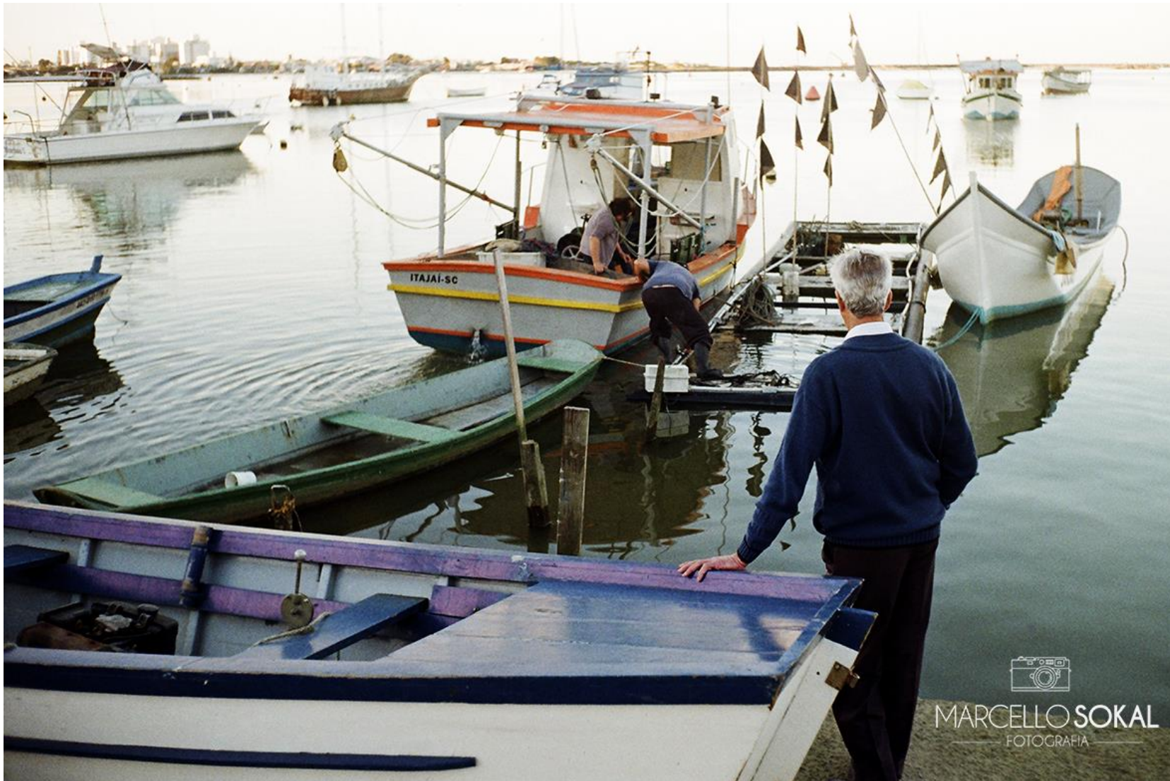
Rio Grande, para mídia publicitária, Rio Grande do Sul