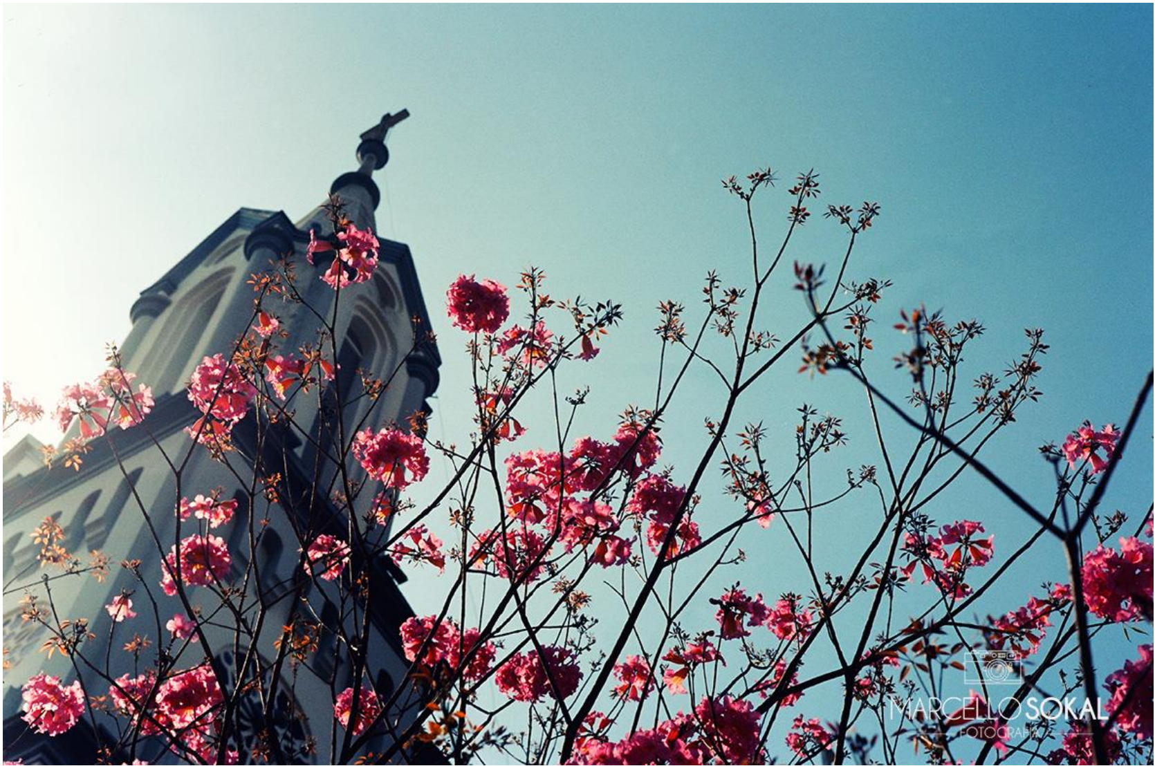
Itajaí, Santa Catarina, para mídia publicitária