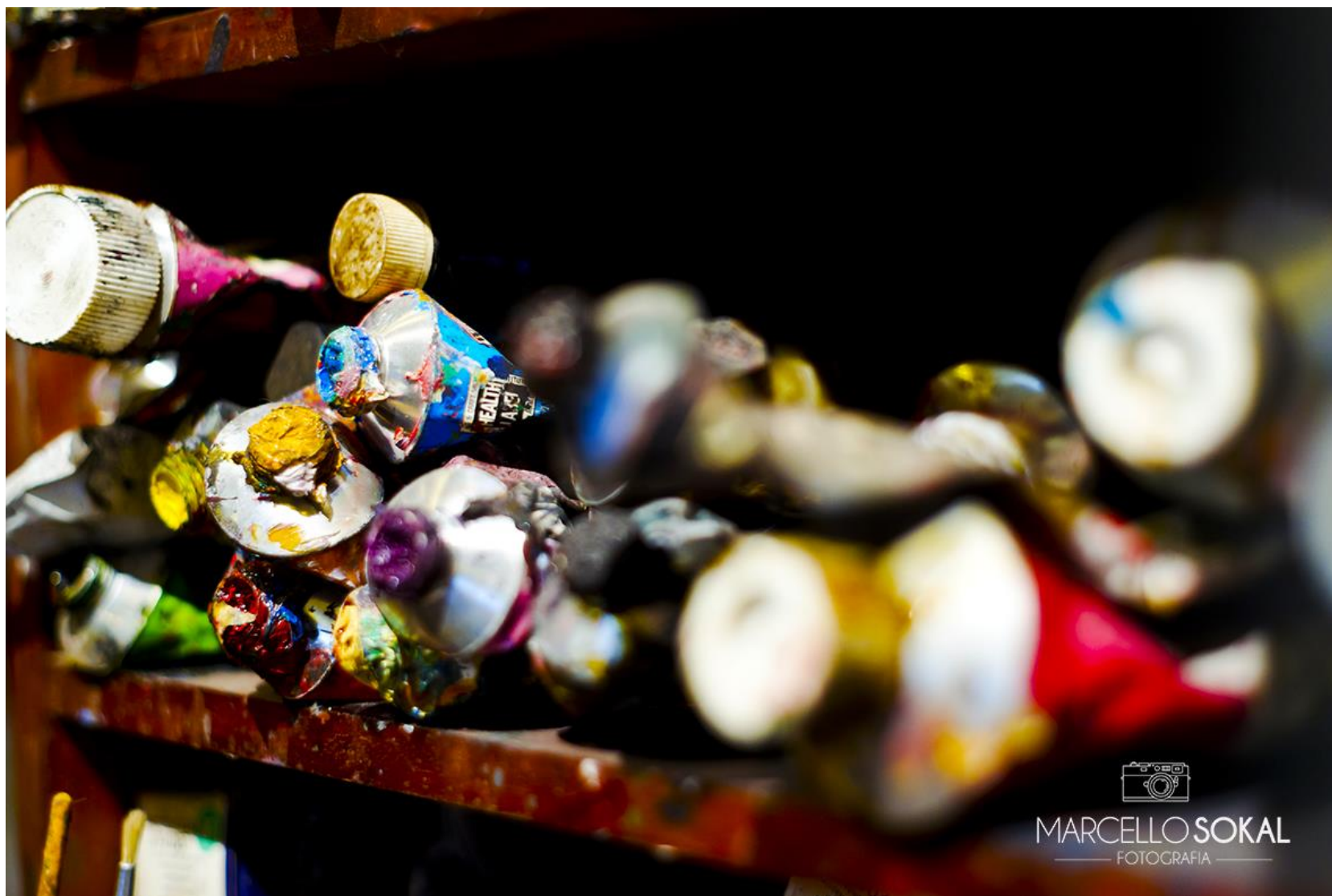
CCBB, para mídia publicitária, Rio de Janeiro