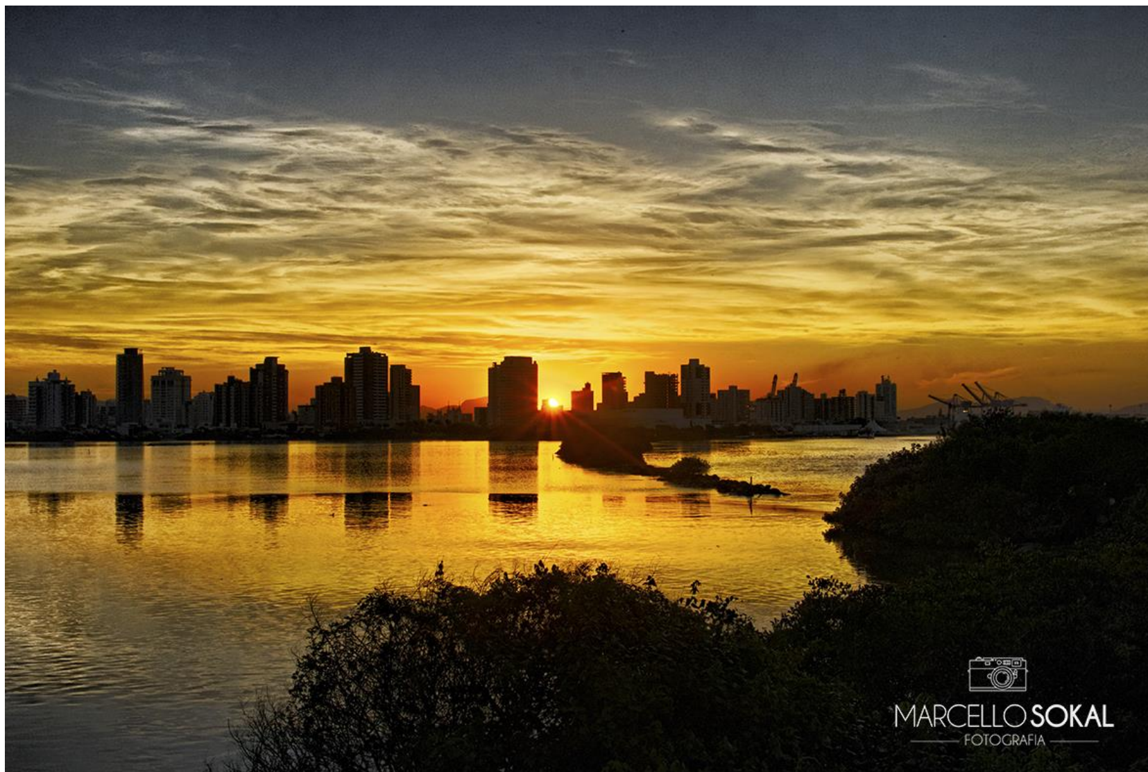
Itajaí, Santa Catarina, para mídia publicitária