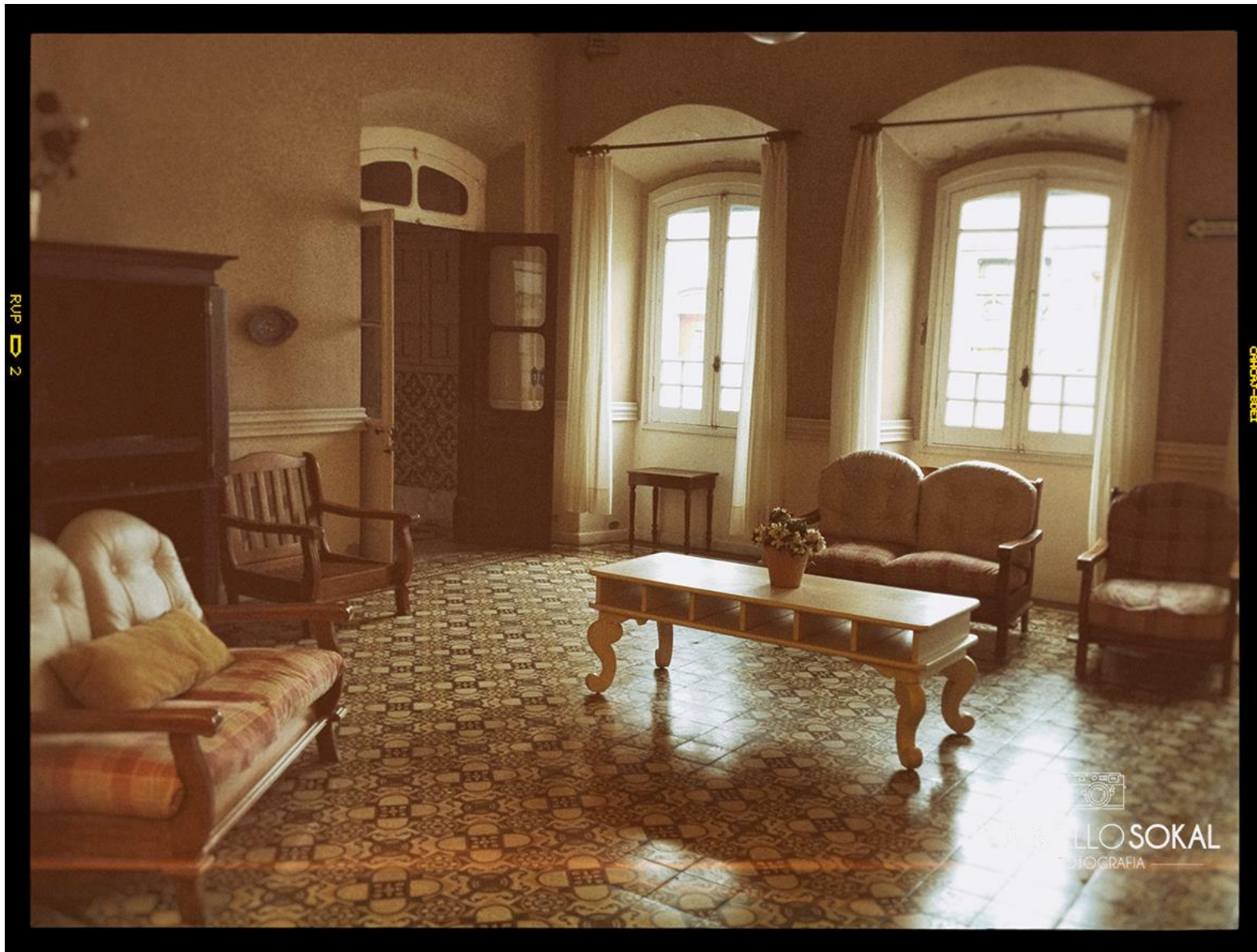
Rio Grande, Rio Grande do Sul, para mídia publicitária