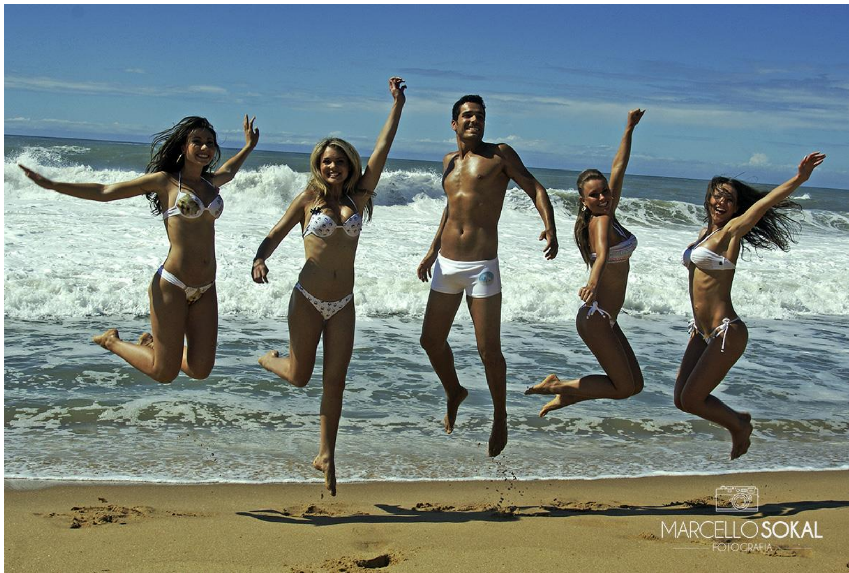
Em Balneário Camboriú, Santa Catarina, para mídia publicitária