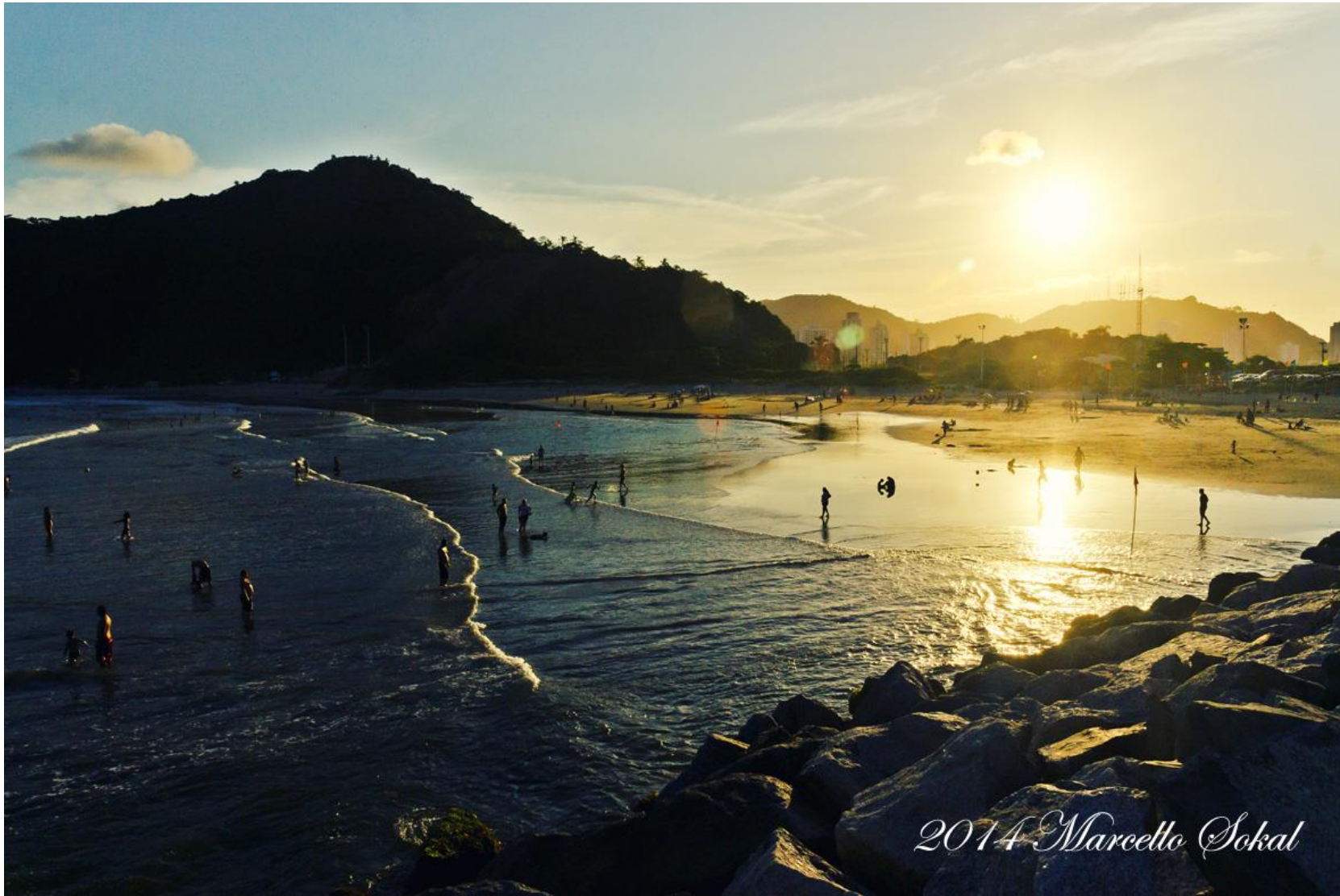
Itajaí, Santa Catarina, para mídia publicitária