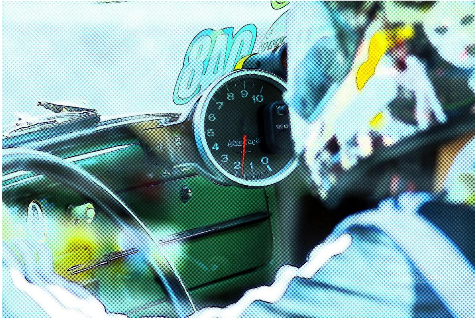
Autoral, Balneário Camboriú, Santa Catarina