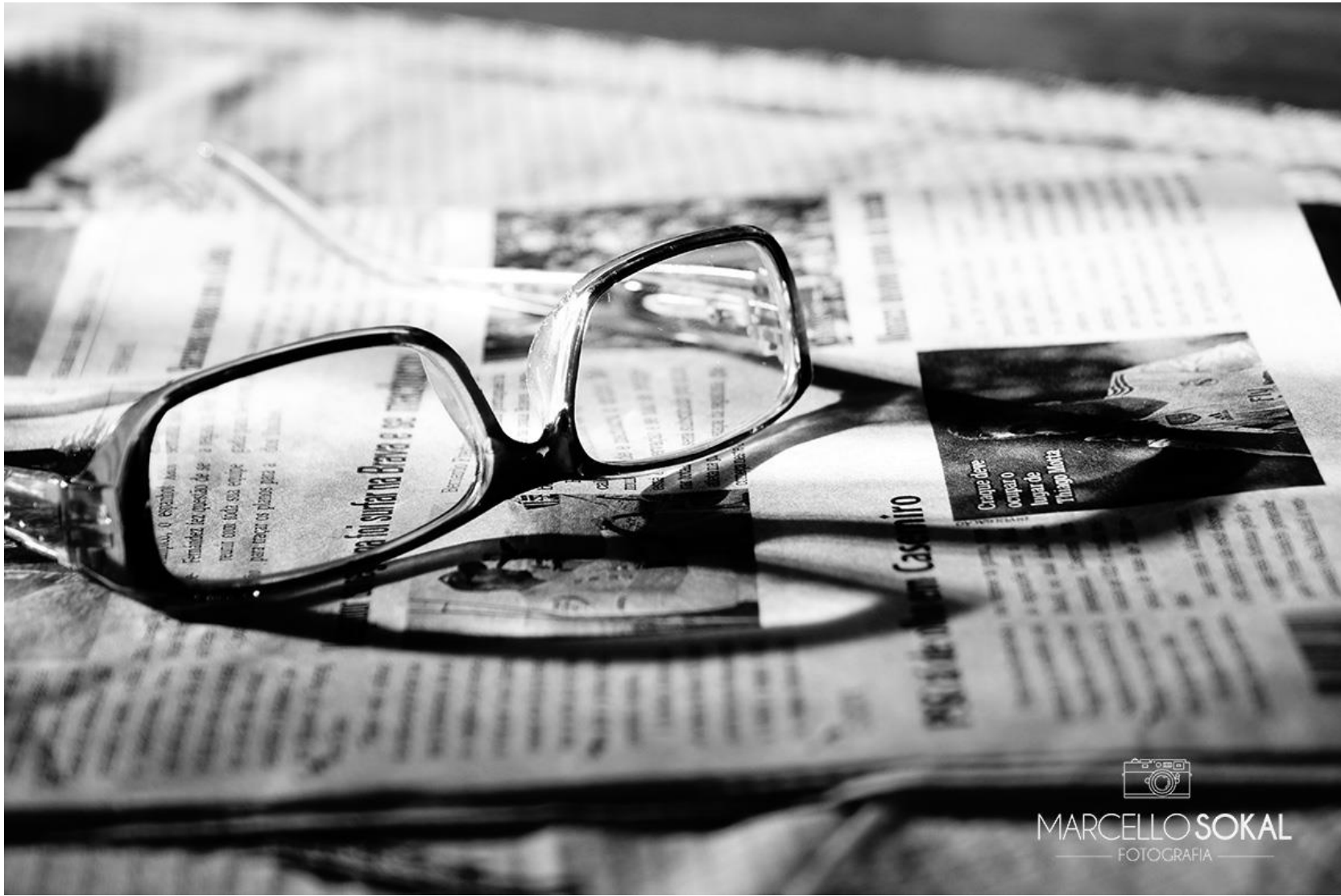
Atoral, Rio de Janeiro