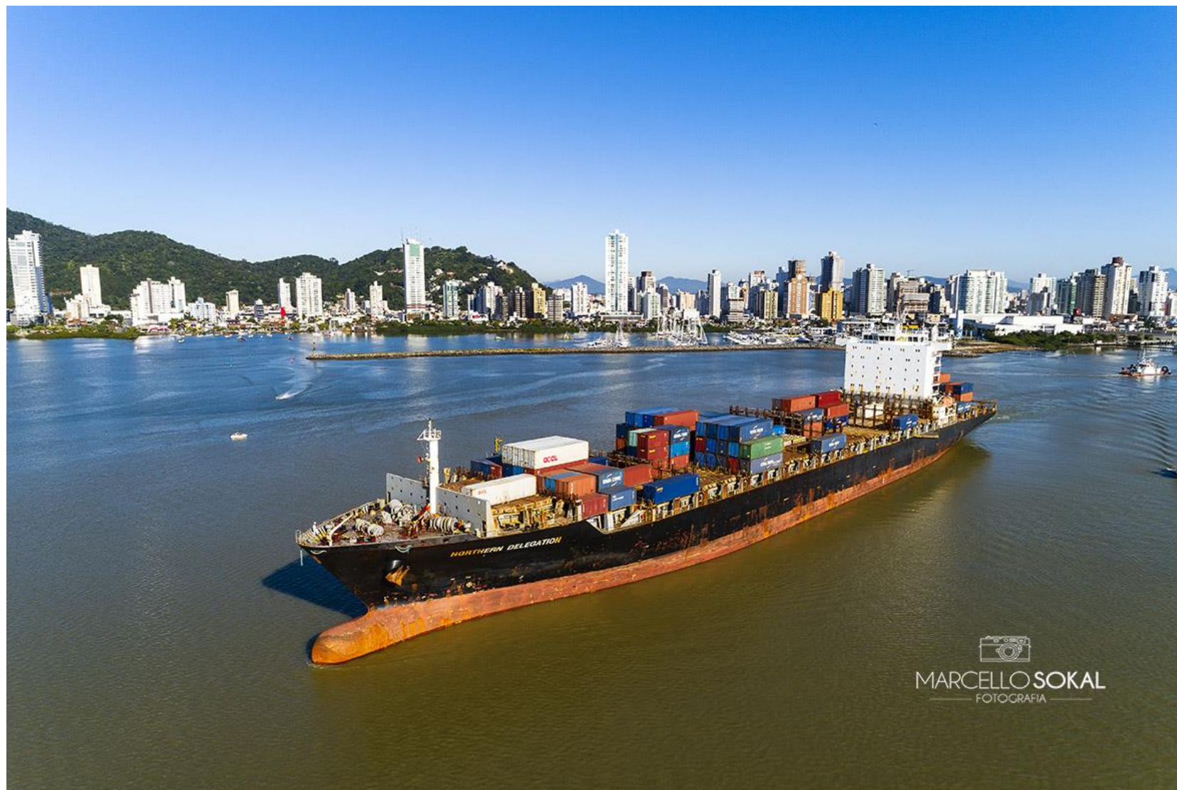
Navio em manobra no rio Itajaí-Açu, Itajaí, SC